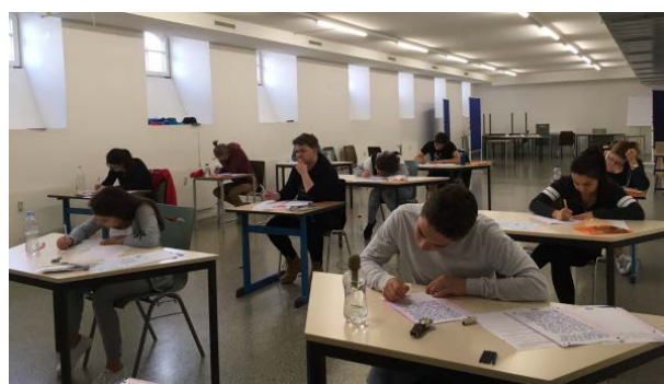
Gute Deutschkenntnisse sind auch in der SIS Basel IB Programme wichtig.